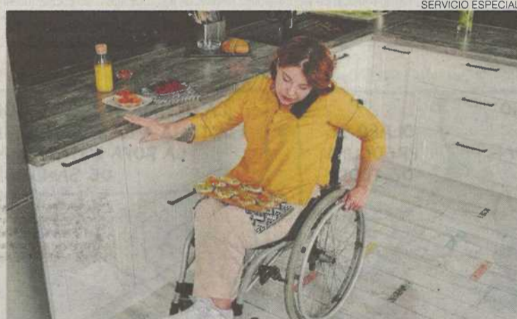
►► La accesibilidad en el hogar muchas veces es complicada.

La convocatoria, publicada en el Boletín Oficial de Aragón (BOA) de 11 de mayo de 2021, está dirigida a personas con un reconoci-