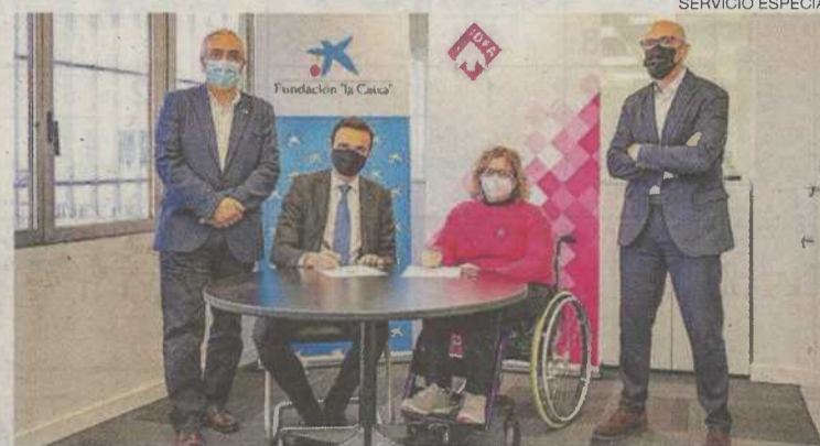
►► Firma entre CaixaBank y la Fundación DFA.

Gracias al programa Sumando Capacidades , que cuenta con el apoyo de la Obra Social de CaixaBank, se va a dotar al Centro de Día del Edificio Josemi Monserrate de la Fundación DFA con tecnologías que permitan a las personas con discapacidad mejorar su calidad de vida a través de la accesibilidad técnica. El pasado 4 de mayo se firmó el convenio que ratifica la colaboración de CaixaBank en este proyecto. La firma con-